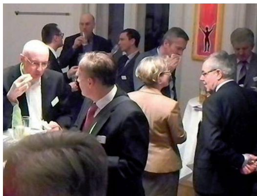
Schnappschuss vom angeregten Gedankenaustausch unter den TeilnehmerInnen des Abends